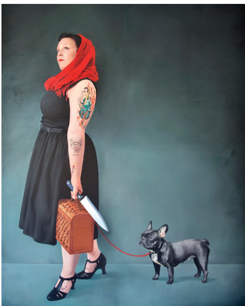
Red Riding Hood is a Big Girl Now, 2017, Öl auf Leinwand, 200x150cm © Simon Czapla