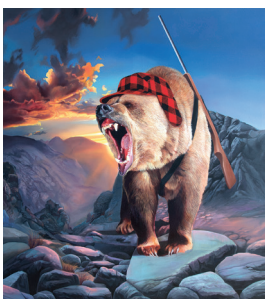
Smit & 2019 Öl auf Leinwand 180x160cm © Simon Czapla