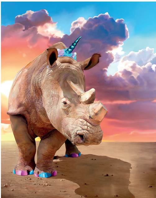
Unihorn, 2021, Öl auf Leinwand, 240x180cm © Simon Czapla