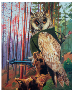
Minerva 2019 Öl auf Leinwand 50x40cm © Simon Czapla