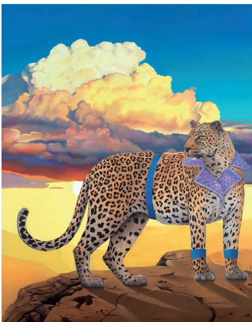
Padded for the Gods, 2022, Öl auf Leinwand, 190x150cm © Simon Czapla