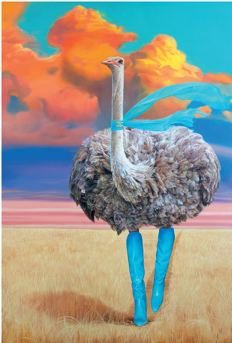
The Skin I'm In, 2021, Öl auf Leinwand, 250x170cm © Simon Czapla